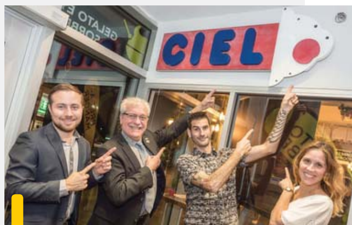
Hommage au patrimoine commercial du boulevard Harwood Une réalisation de l'artiste récupérateur, Nicolas Des Ormeaux, conçue à partir du comptoir et de l'enseigne de la Crémère de Dorion, démolie en février 2016.