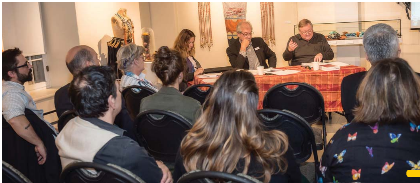
Le 24 octobre dernier, les membres du CACVS se sont réunis en assemblée générale extraordinaire dans les locaux du Musée régional de Vaudreuil-Soulanges.